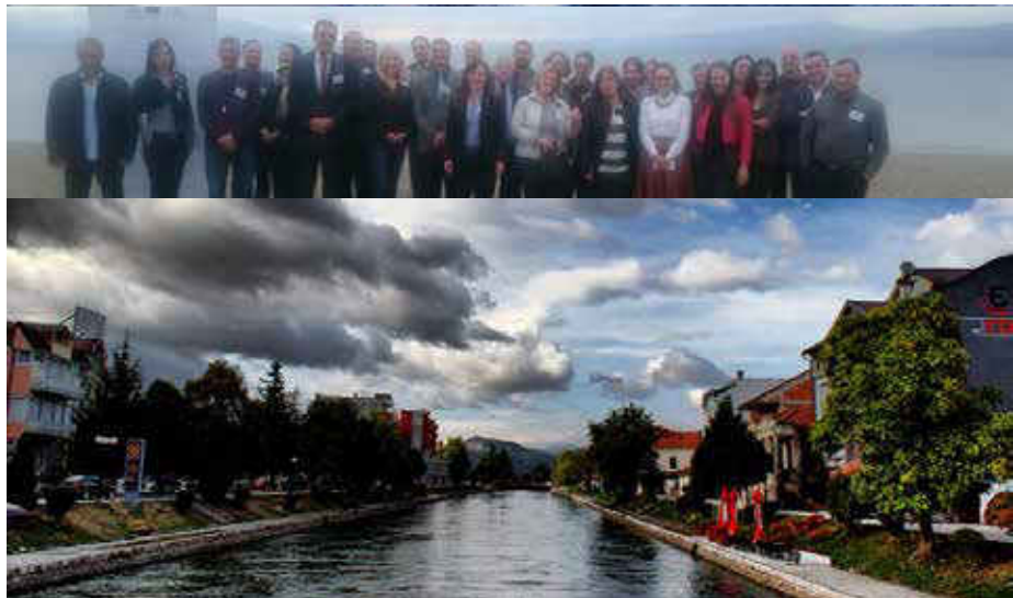
Takimi ndërkufitar dhe Qyteti i Strugës @Unesco

Takimi ndërkufitar për Liqenin e Ohrit u zhvillua në 27-28 tetor në Strugë, Ish republikën Jugosllave të Maqedonisë. Takimi u organizua në kuadër të projektit "Drejt një qeverisje të përbashkët të trashëgimisë natyrore dhe kulturore ndërkufitare të rajonit të Liqenit të Ohrit", financuar nga BE dhe qeveria shqiptare. Kjo platformë ndërkufitare forcon sinergjitë mes strukturave ndërkufitare të menaxhimit, siç është Sekretariati i Përbashkët i Komitetit të Menaxhimit të basenit Ujëmbledhës të Liqenit të Ohrit, dhe iniciativat e tjera si Shpallja 'Njeriu dhe Biosfera e Unesco'. Këto struktura ndihmojnë që të forcohet menaxhimi i rajonit të Liqenit të Ohrit në të dy vendet. Në këtë takim morën pjesë përfaqësues nga Ministria maqedonase e Mjedisit dhe planifikimit fizik dhe Ministria e Kulturës, përfaqësues nga Agjencia kombëtare për Zonat e Mbrojtura, Anëtarë të sekretariatit të përgjithshëm të Komitetit ndërkufitar të Basenit Ujëmbledhës të Liqenit të Ohrit dhe kryebashkiakët e Strugës dhe Pogradecit, si dhe përfaqësuesit nga qeveritë lokale të Ohrit. Pjesëmarrësit ishin në një mendje se projekti i rajonit të Liqenit të Ohrit po zbatohet në mënyrë të kënaqshme, dhe se gjithë çështjet e planifikuara janë adresuar brenda zbatimit të projektit. Sidoqoftë është rënë dakord se disa aktivitete duhet të shpejtohen në mënyrë që të arrihen afatet e kërkuara. Bëhet fjalë veçanërisht për finalizimin e Planit të Menaxhimit për Dosjen e