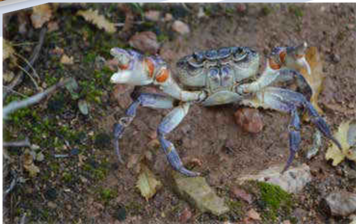
Speciet e Liqenit të Ohrit.