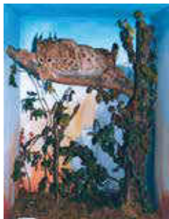
Pjesëza nga Muzeu i Struges