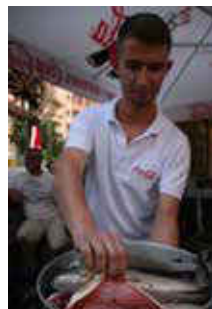
Restaurant in Pogradec