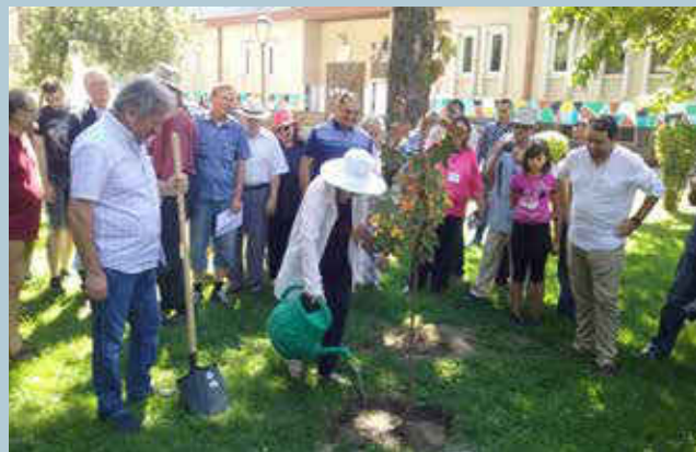
Margaret Atwood duke mbjellë pemën e saj në Parkun e Poezisë, Strugë