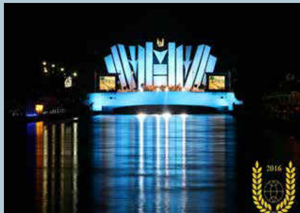
Festivali i 55-të i Mbrëmjeve të Poezisë në Strugë

Margaret Atwood, poetja dhe shkrimtarja 76 vjeçare kanadeze është fituesja e Kurorës së Artë të këtij viti në "Mbrëmjet e Poezisë" Strugë. "Jam shumë e surprizuar dhe e lumtur që u zgjodha për Kurorën e Artë të këtij viti dhe veçanërisht edhe më e lumtur që të marr pjesë në Mbrëmjet e Poezisë Strugë. Ju faleminderit që e përkthyet poemën time në gjuhën tuaj. Është një përpjekje heroike. Ne poetët duhet t'u jemi mirënjohës përkthyesve, - tha Atwood në hapjen e festivalit. Ajo pasi falenderoi për çmimin, lexoi për të pranishmit poemën e saj "Sekretet". Atwood theksoi se në një periudhë të shkurtër në Strugë, ajo u ndje e mrekulluar nga mikpritja e ngrohtë dhe bisedat e këndshme me banorët e saj. Shkrimtarja kanadeze mbolli një pemë në Parkun e Poezisë në Strugë. Çdo vit fituesi i festivalit ka nderin të mbjellë një pemë në Parkun e Poezisë Strugë. Kjo është një traditë e madhe që tregon se si pemët dhe librat jetojnë së bashku dhe plotësojnë njëra tjetrën. Qyteti i poezisë dhe urave, qyteti i vëllëzerve Mladinov, për të 55-in vit rresht ka rritur reputacionin e tij si kryeqyteti i poezisë. 32 poetë nga 30 vende, si Kanada, Itali, Australi, Emiratet e Bashkuara Arabe, Turqi, Belgjikë, Izraeli, Hungari, Kinë, Kolumbi, Meksikë, Spanjë, Francë, Irlandë, Indi, Bullgari, Shqipëri, Argentinë, Brazil, Kroaci, Gjermani, Lituan, Marok, Palestinë, Poloni, Serbi dhe Sllovakia, dhe 20 poetë nga Maqedonia morrën pjesë në këtë edicion jubilee të Mbrëmjeve të Poezisë në Strugë.