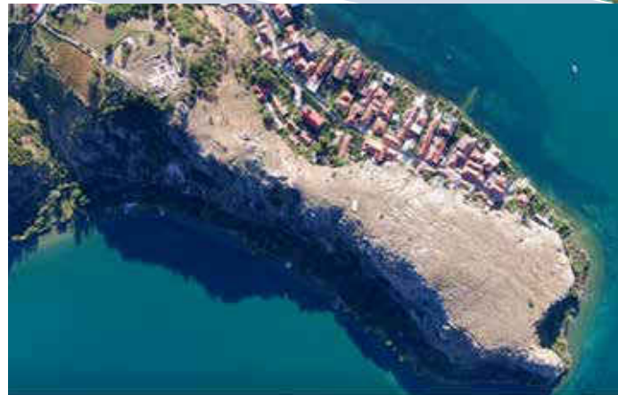
Fshati i Linit filmuar me dron.