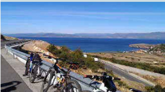
Me bicikletë rreth Liqenit të Ohrit.