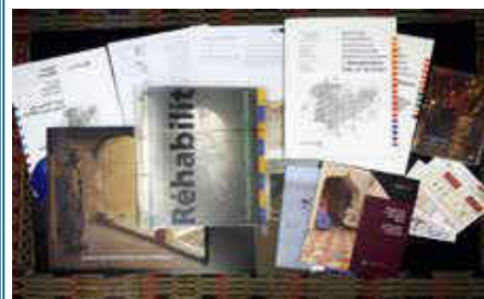
Broshurat e ICOMOS