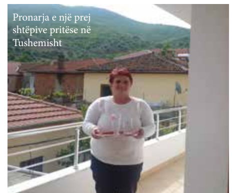
Pronarja e një prej shtëpive pritëse në Tushemisht

Restoranti tradicional “Lokali Zonja nga Qyteti” në qendër të Tushemishtit, gjithashtu në pronësi të një zonje, është shumë i frekuentuar si nga vendasit dhe vizitorët. Aty të serviret lakror i madh, tip byreku tradicional i gatuar me peta dhe barishte apo zarzavate, të shoqëruar me qofte dhe sallatëra. Pijet lokale shoqëruese janë verë dhe raki, me një varietet special të gjelbër të ngjyrosur nga gjethet e mollës që i japin një shije unike. Tre gra, përfshi dhe pronaren, përveshën mëngët për të përgatitur lakrokrin për pjesëmarrësit e seminarit të turizmit. Miqtë u ndjenë si në shtëpi në këtë fshat të vogël, falë ngrohtësisë dhe mikpritjes së grave të Tushemishtit. Dhe ato janë vetëm disa nga Gratë e Tushemishtit.