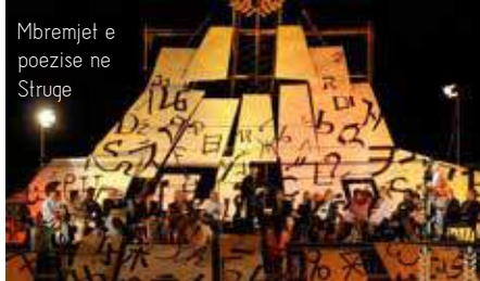
Mbremjet e poezisë ne Struge

Struga e sotme është mjaft moderne. Dikush mund të shijojë një shëtitje të këndshme nëpër qytet përgjatë lumit dhe bregut të liqenit. Një destinacion kryesor është Pazari i Vjetër, një treg gjallërues i rrethuar me shtëpi tradicionale, kafene dhe dyqane. Aty pranë kryqëzimit ndodhet dhe Kisha e Shën Gjergjit, e