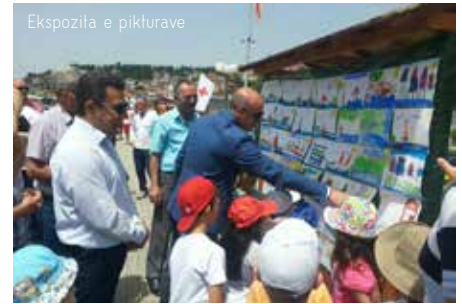
Ekspozita e pikturave