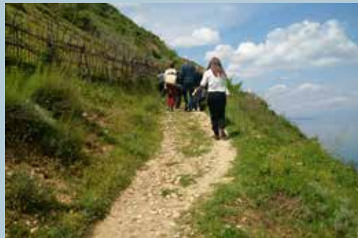
Pjesëmarrësit e trajnimit duke vizituar kalane e Pogradecit

përparimin e procesit të planifikimit të menaxhimit, në funksion të zgjerimit të pjesës shqiptare të pasurisë së Trashëgimisë Botërore të rajonit të Liqenit të Ohrit, me ide që do të adresojnë nevojën për ndërtuar histori unike rreth një identiteti të përbashkët për këtë trashëgimi të përzier ( natyrore dhe kulturore) ndërkuftare.