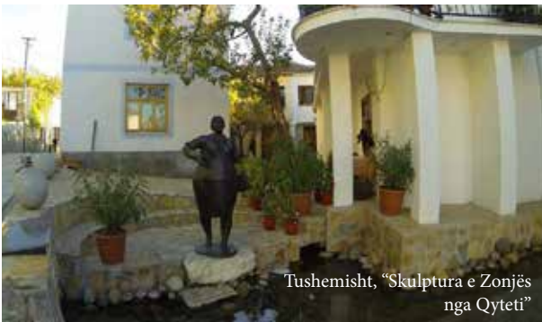
Tushemisht, “Skulptura e Zonjës nga Qyteti”

“Një kombinim përfekt i mikpritjes dhe privacisë totale për miqtë. Jashtëzakonisht pastër. Në këtë fshat të qetë ju mund të dëgjoni vetëm ujën e burimit që rrjedh nëpër kanale përgjatë rrugëve gjatë natës. Mëngjesi më i mirë që kam ngjënë prej vitesh-i thjeshtë por vertet një produkt i veçantë lokal.”