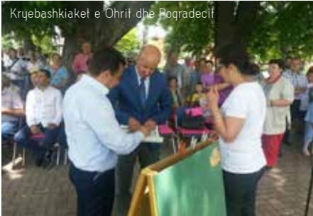
Kryebashkiaket e Ohrit dhe Pogradecit

21 qershori është dita e Liqenit të Ohrit. Ky vendim u morr 16 vite më parë nga Bordi i përbashkët i Menaxhimit të Liqenit të Ohrit. Është një ditë ku gjithë komunitetet që jetojnë në brigjet e Liqenit të Ohrit kujtojnë vlerat unike të tij. Komunitetet lokale duhet t'u mësojnë fëmijëve të tyre të duan dhe mbrojnë këtë thesar natyror. Me këtë rast çdo vit në bazë rotacioni, tre bashkitë rreth Liqenit të Ohrit (Ohri, Pogradeci dhe Struga), organizojnë aktivitete festive. Këtë vit kjo ditë u festua në qyte-