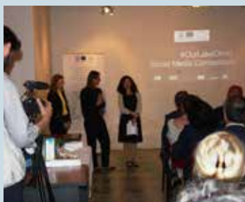
Ceremonia e çmimeve në Pallatin e Kulturës, Pogradec