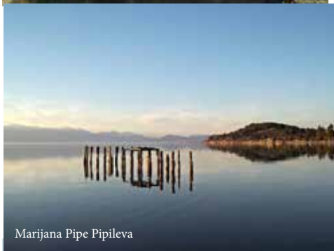
Marijana Pipe Pipileva