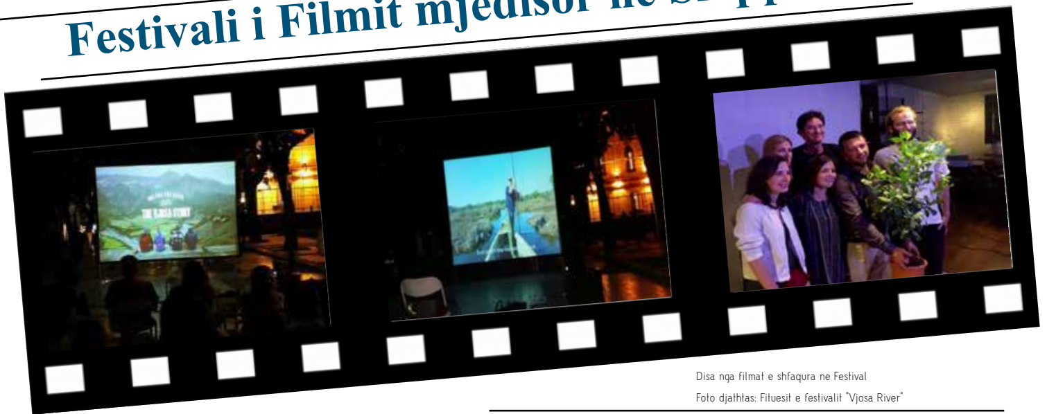
Disa nga filmat e shfaqura ne Festival